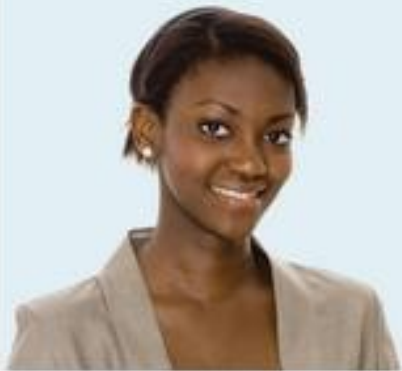
Table de concertation du mouvement