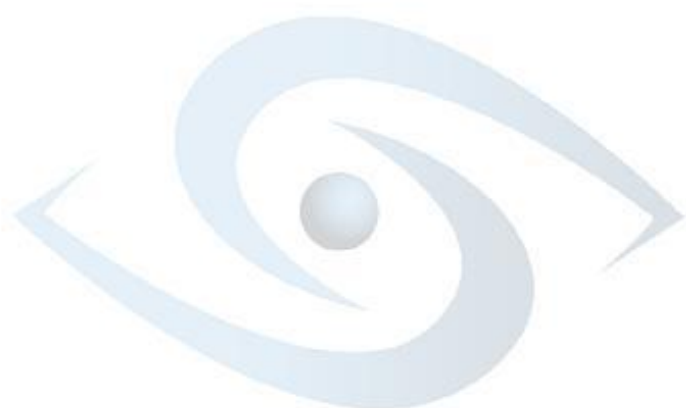
Table de concertation du mouvement