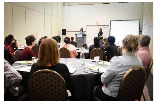
Sonia Lebel – Ministre de la Justice, prenant la parole le 1 er février 2020